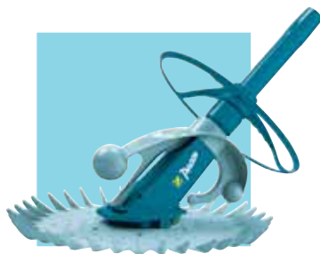
ROBOT AUTOMATIQUE PACER

Groupe de filtration à sable complet, composé d'une platine, d'une pompe avec pré-filtre et d'un filtre équipé d'un bouchon de vidange. Livré avec une vanne top 6 voies.