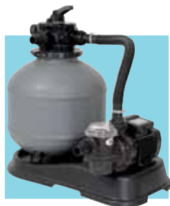
GROUPE DE FILTRATION

Un savant mélange de design moderne et d'innovation. En effet, notre bureau de Recherche et Développement a volontairement donné à cette piscine un design architectural en associant les poteaux en résine dans les parties courbes et les poteaux en acier galvanisé peints dans les parties droites.